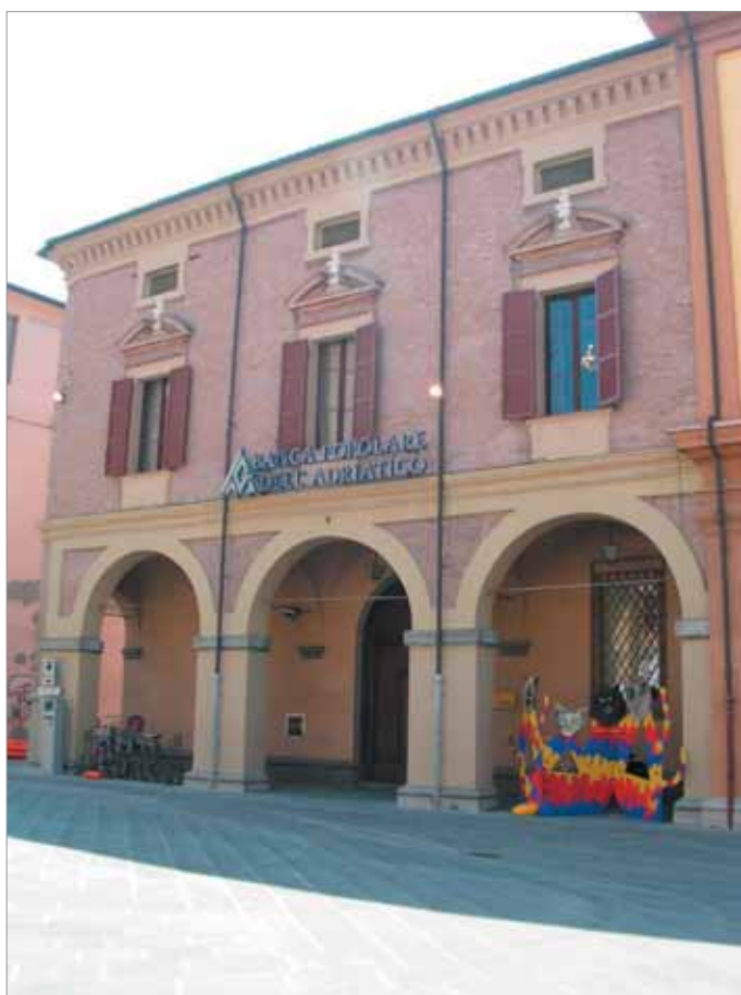
Piazza della Libertà 1 Fronte Principale