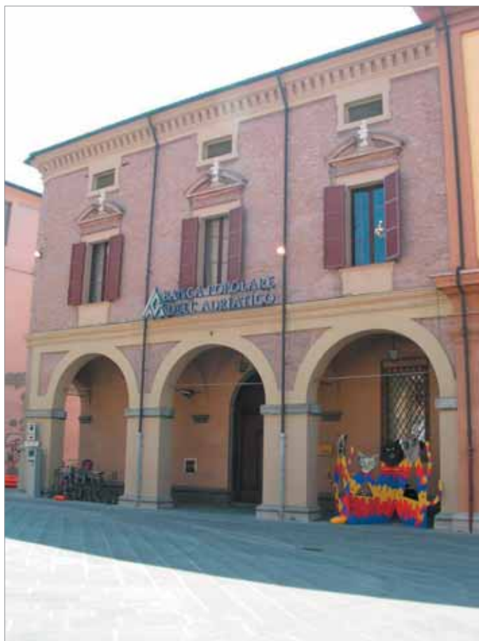
Piazza della Libertà 1 Fronte Principale